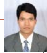
■ अनन्त यात्री